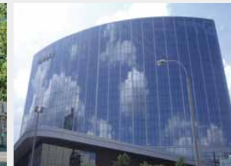
Hotel Hyatt, Rusia: Reabilitarea betonului cu diverse mortare de reparații Sika