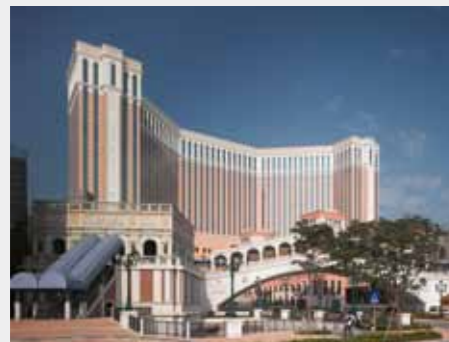
Macau Venetian, China: Aditivi Sika pentru betoane de la fundație până la acoperiș.