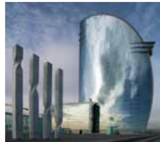
Lipire structurală și etanșare rezistentă la intemperii pentru fațade de sticlă