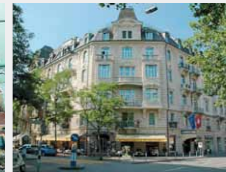
Hotel Ambassador, Elveția: Soluții de impermeabilizare și reabilitare