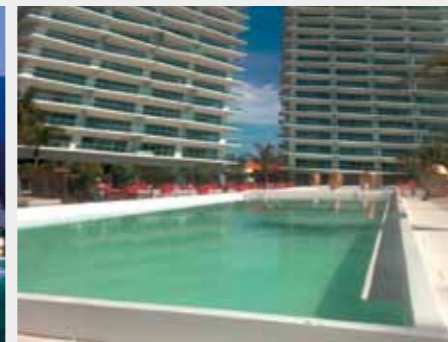
Hotel Torre Icon, Mexic: Soluție Sika de impermeabilizare pentru piscină