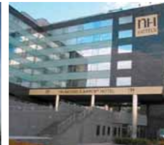
Sigilanți Sika pentru etanșarea rosturilor la fațade