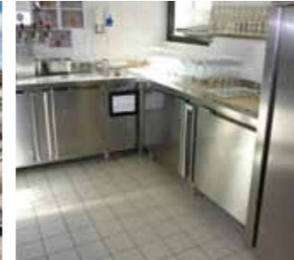
Soluții Sika de impermeabilizare pentru camere umede