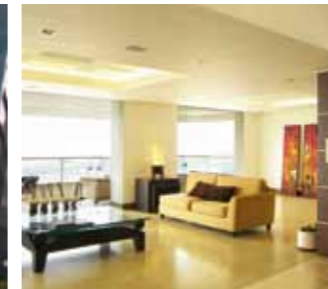
Sigilanți Sika pentru toate tipurile de amenajări interioare