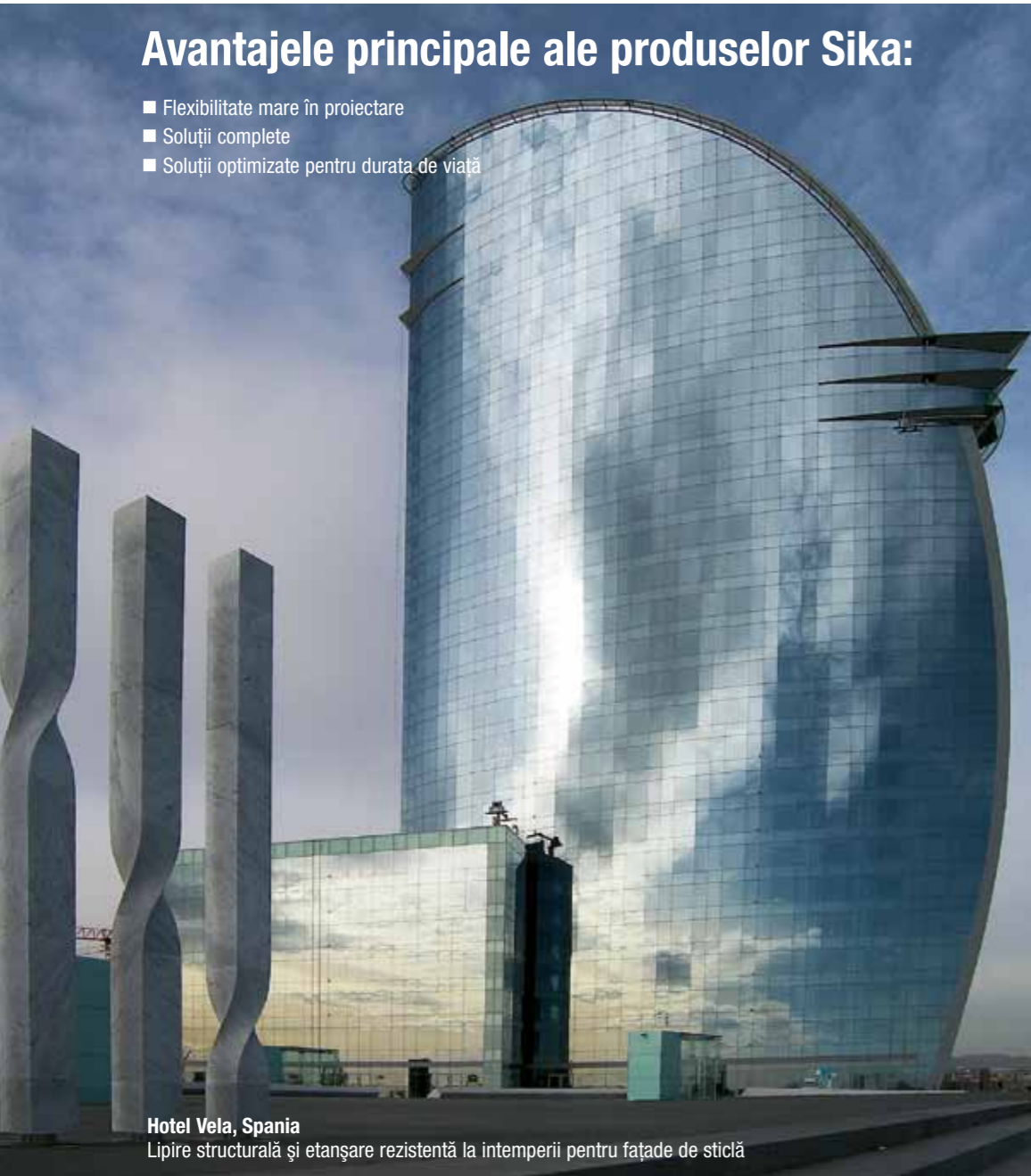
Hotel Vela, Spania Lipire structurală și etanșare rezistentă la intemperii pentru fațade de sticlă