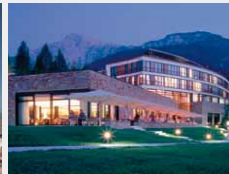
Resort Hotel Intercontinental, Germania: Impermeabilizare cu strat Sikafloor pentru pardoselile de bucătărie