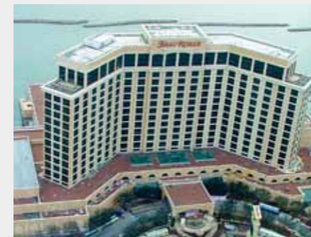
MGM Beau Rivage, SUA: Soluție Sika pentru acoperișul clădirii de 29 de etaje