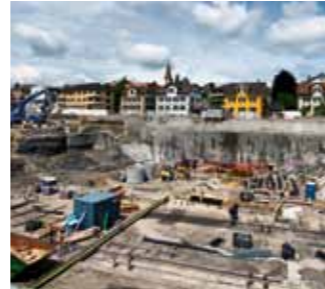
Soluții Sika de impermeabilizare pentru fundații și subsoluri