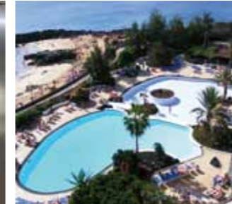
Soluții Sika de impermeabilizare pentru piscine