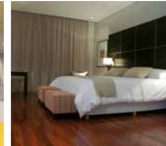
Sisteme SikaBond pentru lipirea pardoselilor de lemn din camerele de odihnă