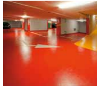
Sisteme Sikafloor® pentru parcări auto durabile