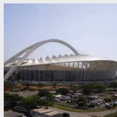
Stadionul Moses Mabhida, Africa de Sud Sika a furnizat soluții pentru etanșarea rosturilor, protecția betonului și subturnări.