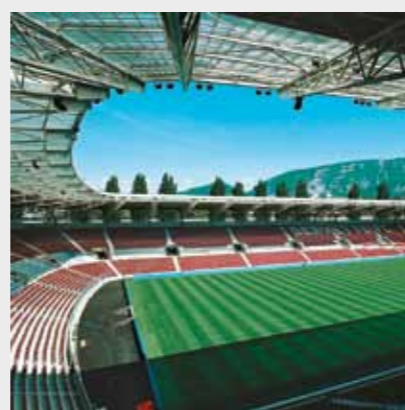
Stade de Genève, Geneva, Elveția Sika a furnizat soluții de aditivi performanți pentru betoane, pardoseli, lipirea pardoselilor de lemn, protecții anticorozive pentru metal și oțel.