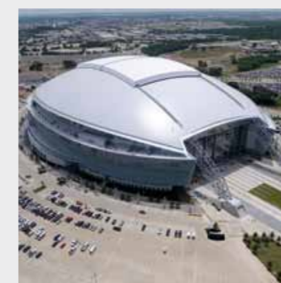
Stadionul Cowboys, Dallas, SUA Sika a furnizat soluții pentru pardoseli, etanșarea rosturilor, acoperișuri.