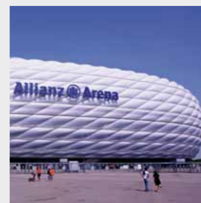
Allianz Arena, München, Germania Sika a furnizat soluții pentru etanșarea rosturilor, lipirea pardoselilor de lemn.