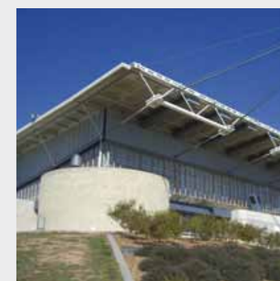
ALS Arena, Canberra, Australia Sika a furnizat soluția pentru acoperiș – funcționează deja de 29 de ani și rezistă încă foarte bine.