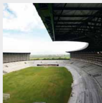
Stadionul de fotbal Deportivo Cali, Columbia Sika a furnizat soluții de aditivi pentru betoane, consolidări structurale, etanșarea rosturilor, subturnări, ancorări, protecția betonului și pardoseli.