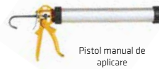
Pistol manual de aplicare