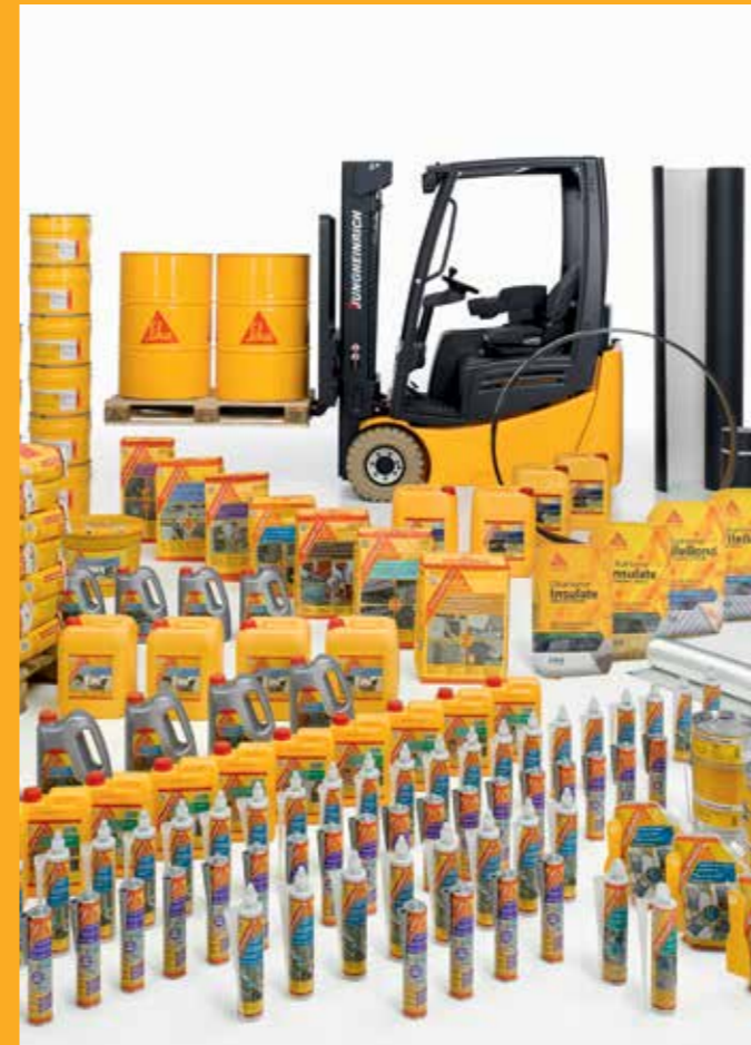
© Sika Romania SRL / Industry / SikaBond® / Marketing / I.L.L. / 03.2015

Sediu Central 050562 București, Sector 5, Str. Izvor, Nr. 92-96, Clădirea Forum III, Etaj 7 Tel.: +40 21 317 33 38 Fax: +40 21 317 33 45 www.sika.ro