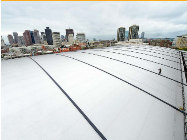
ACOPERIȘURI | ROOFING