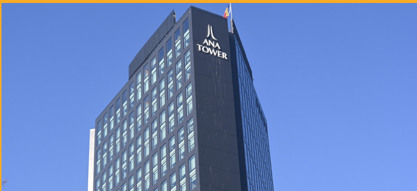
Ana Tower, București, România | Ana Tower, Bucharest, Romania

Growing demand in this market is fueled by a growing awareness of the importance of high-performance sealants for the overall durability and energy efficiency of buildings, growing urbanization, including higher volumes of tall projects, and the continued replacement of fasteners. mechanical with adhesives due to better performance.