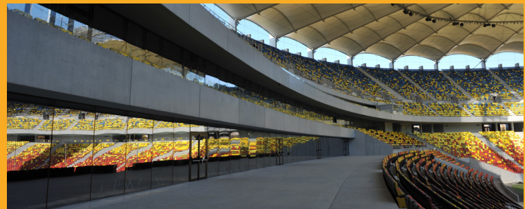
Arena Națională "Lia Manoliu", București, România | National Arena "Lia Manoliu" in Bucharest, Romania.

Key market segments include basements, underground car parks, tunnels and all types of water retention structures (eg tanks, storage basins). Waterproofing systems are facing increasingly stringent requirements in terms of sustainability, ease of application and total cost management. Therefore, the selection of suitable waterproofing systems to suit the needs and requirements of the owners, as well as the treatment of specific project-related details, is essential for long-lasting watertight structures.