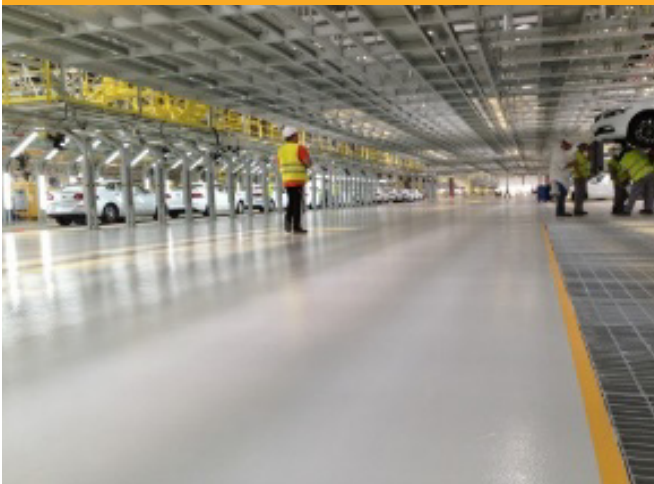
PARDOSELI | FLOORING