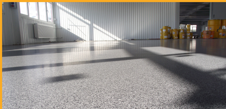
Soluții de pardoseală pentru industria textilă Speidel, România | Flooring solutions for textile industry Speidel, Romania

Sikafloor® Sikafloor® MultiFlex Sikafloor® EpoCem® Sikafloor® DecoDur Sikafloor® PurCem® Sika® Comfortfloor® Sikafloor® MultiDur Sikafloor® Level