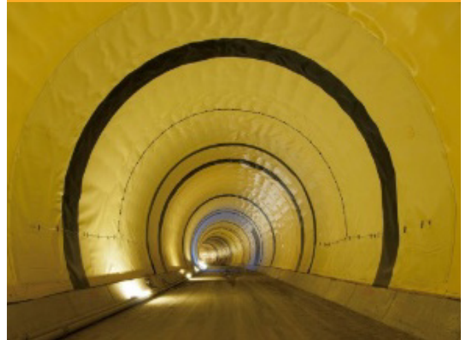
IMPERMEABILIZARE | WATERPROOFING