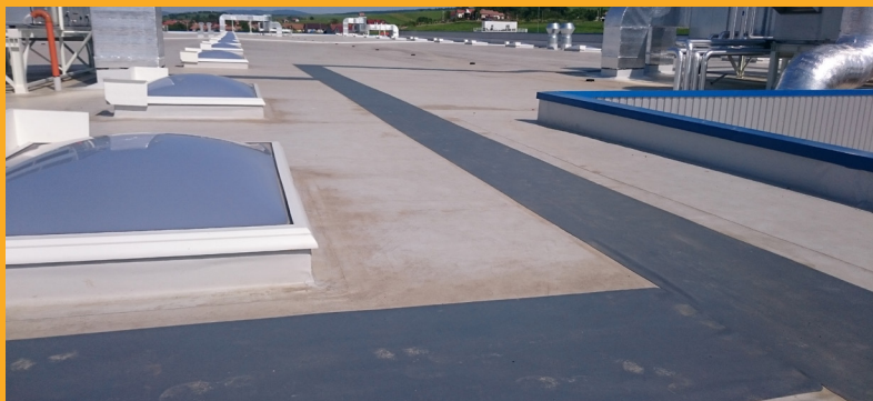
GST Automotive, Sighișoara, România | GST Automotive, Sighisoara, Romania

Sika offers a full range of roofing systems built with single-layer roofing systems and incorporating flexible membranes and liquid membranes as well as thermal insulation and various roofing accessories. A history of over 50 years has documented that Sika roofing solutions offer exceptional performance, reliable, durable and long lasting. Demand in this segment is driven by the need for environmentally friendly, energy-saving solutions, such as green roof systems, cold roofs and solar roofs, which simultaneously help to reduce CO2 emissions. While renovation projects continue to gain importance in mature markets, emerging markets are moving towards high-quality roofing solutions for newly built structures.