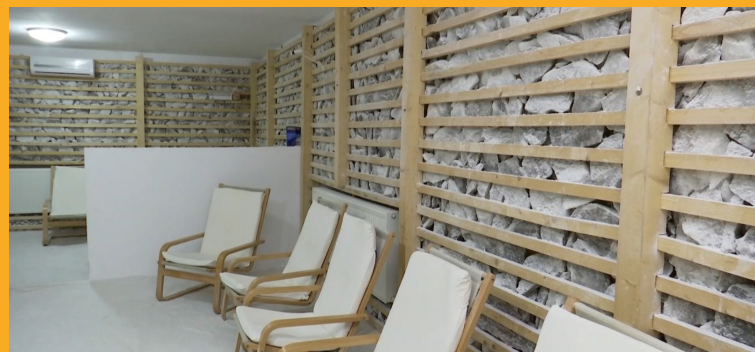
Centru de recuperare post-Covid, Runcu, România | Post Covid recovery center from Runcu, Romania