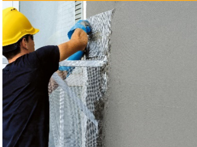
FINISARE CLĂDIRI | BUILDING FINISHING