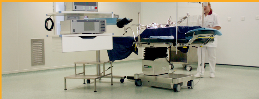
Strat de protecție antiseptic cu ioni de argint, spitalul Sfântu Constantin, Brașov, România

Building Finishing focuses on residential and commercial buildings, for which Sika offers one of the most comprehensive ranges of solutions dedicated to ceramic cladding, protection and decoration of facades, as well as interior finishing of walls. Featuring in particular adhesives as well as systems for waterproofing and sound reduction for ceramic tiles. Sika's offer also includes products for exterior and interior walls, such as wall leveling products, decorative finishes and exterior insulation finishing systems (EIFS). The global trend of urbanization and the growing need for home improvement continue to fuel the market. With a strong presence in rapidly evolving distribution channels, service to entrepreneurs and a complete portfolio of complementary technologies for enveloping buildings from basement to roof, Sika addresses the growing demand for quality, comfort, aesthetics and environmentally friendly solutions.