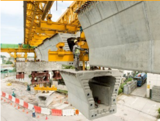
BETOANE | CONCRETE