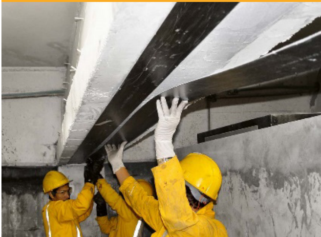
REPARAȚII ȘI REABILITĂRI | REFURBISHMENT